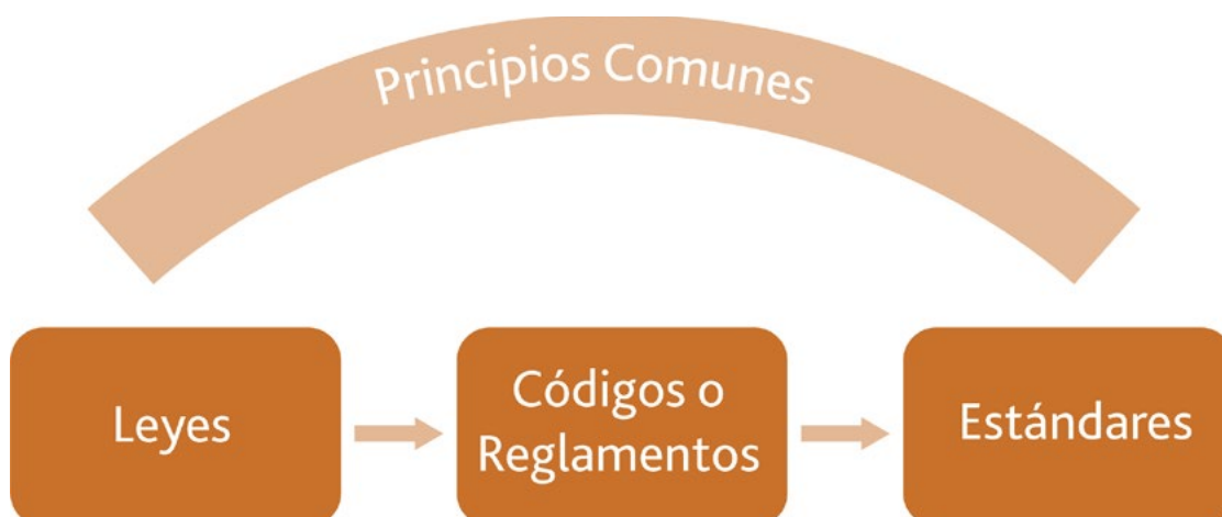
Figura 3: Interacción de los Principios Comunes con Leyes, Códigos o Reglamentos y Normas

La siguiente Figura 3 muestra la interacción entre leyes, reglamentos, códigos y estándares y cómo los Principios Comunes descritos en este documento pueden aplicarse en cada etapa.