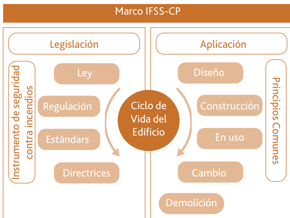
Figura 4: Marco IFSS-CP

El Marco IFSS-CP es un primer paso importante para lograr un diseño y una gestión coherentes de la seguridad contra incendios en bienes inmuebles durante el diseño, la construcción, el uso, la modificación y la demolición. Trabaja con los estándares internacionales, supranacionales y nacionales existentes para proporcionar la base para mejorar los procesos existentes y lograr una mayor transparencia y coherencia dentro y entre jurisdicciones (consulte la Parte 5).