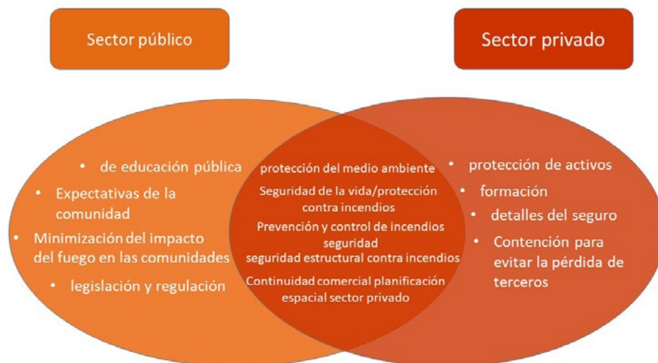
Figura 5: Circunstancias Marco IFSS-CP