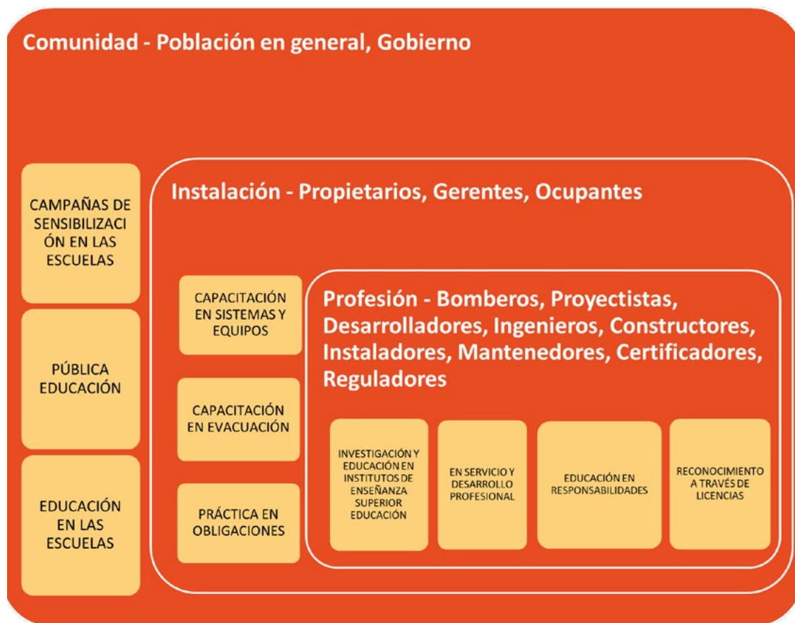
Figura 2: Educación y difusión de información que respalda el IFSS-CP