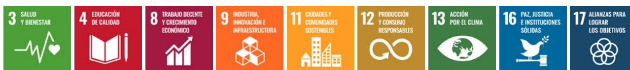
Figura 1: Objetivos de Desarrollo Sostenible de la ONU aplicables

La seguridad contra incendios se relaciona con los objetivos de desarrollo sostenible de la ONU 3, 4, 8, 9, 11, 12, 13, 16 y 17: